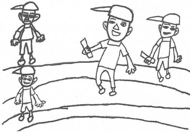
2-1 こまがた みずほ