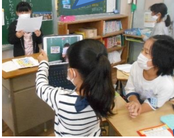
班で、互いの発表の様子をタブレットで録画