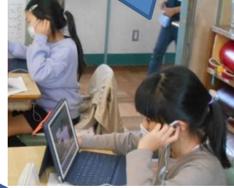
友達のアドバイスや録画した動画をもとに、振り返る