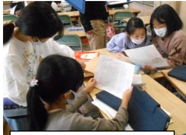
班で、互いの発表についてアドバイスを