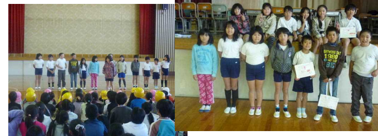
11/21 坂っ子カーニバル