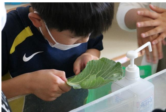
あおむしいるかな？（3年生）