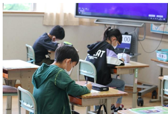
ローマ字の学習中（4年生）