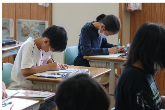
合同な図形の作図に挑戦（5年生）