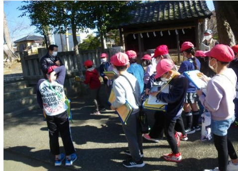
3年 総合的な学習(梅名史跡めぐり)