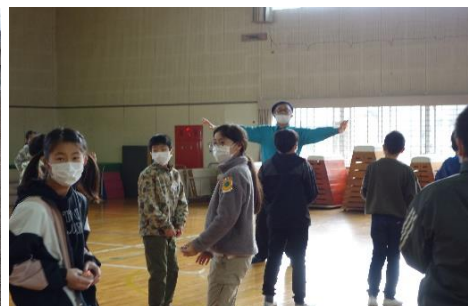
6年 学校保健委員会・家庭科