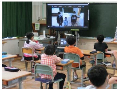
6年生が1年生を紹介