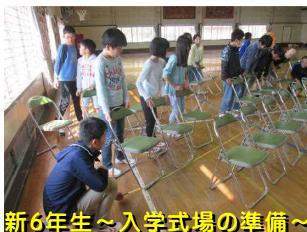
新6年生～入学式場の準備～

まずは、新6年生。彼らのリーダーとしての自覚ある行動が、4日（水）、さっそく発揮されました。新入生を迎える神聖な「入学式場」づくりに取り組む姿は無言ではありましたが、上級生として、また、北上小学校の顔としてのプライドのようなモノを感じました。