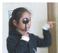
新1年生の 測定の様子

低学年の子どもたちも、静かにてきぱきと測定してもらうことができていました。年度変わりは成長の足跡が見える時期だと、こんな場面でも感じます。毎日見ていると気づかない発育の様子です。家庭でも数値を確認してみてください。