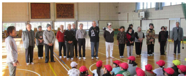
一緒に遊んでくれた芙蓉台老人会の皆様

「子どもは遊びの天才」 15日、1年生が元祖天才の方々より昔の遊びをたくさん教えていただきました。笑顔のあふれる時間でした。