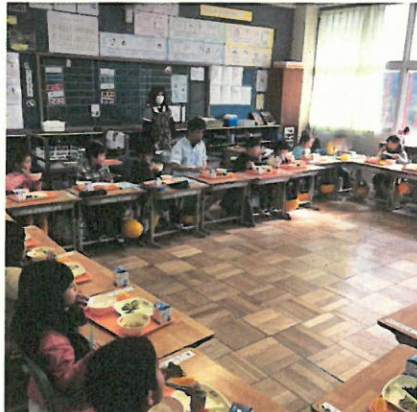
給食週間(調理員さんとの会食)