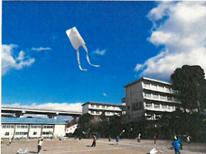
1年 生活科たこ揚げ