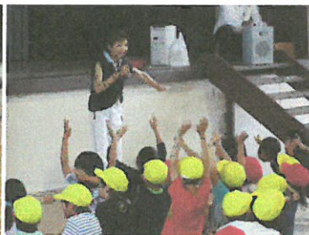
5月三島サンバ講習