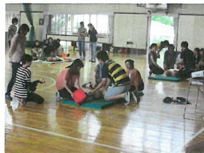
③救急法講習会(AED研修)[10日]