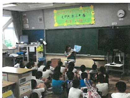
⑥図書ボランティア読み聞かせ[20日]

この他にも、3年生が社会科の勉強で三島市の公共施設(ゆうゆうホールや生涯学習センター)を見学したり、1年生がジンタ号(移動図書館)のデビューをしたり、2年生が三島ホテルの会の出前授業を受けたりしました。