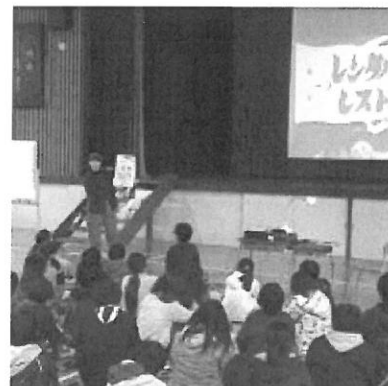
スギヤマカナヨワークショップ