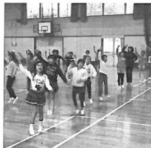
レッツ三島サンバ