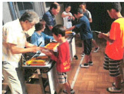
②福祉鉛筆の販売[9日]