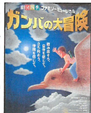
「力を合わせて仲間を守れ！」