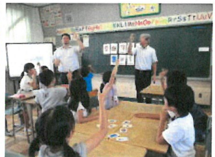
③低学年、中学年外国語活動(学活)