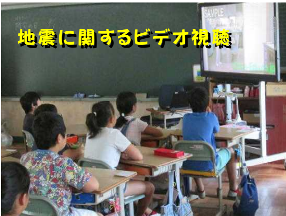
地震に関するビデオ視聴

防災の日、本校でも揺れ(の合図)と共に実施しました。机にもぐり頭を保護する子どもたちの様子も真剣で、『自分の身を自分で守る』意識が高まってきていることが感じられました。