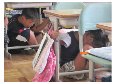
急いで机に潜り込む！

防災の日、本校でも揺れ(の合図)と共に実施しました。机にもぐり頭を保護する子どもたちの様子も真剣で、『自分の身を自分で守る』意識が高まってきていることが感じられました。