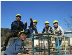
寒空のもと元気よく！

低学年では縄跳びを苦手とする子どもが意外と多いようです。寒い中、勢いよく回る縄にあたった痛い経験がそうさせているのかもしれない。「不安な表情」を浮かべる子どもたちの背中をそっと押す担任など回し手。「えい！」とばかりに跳べた瞬間に「笑顔」になる子どもたち。寒い日の温かい時間です。