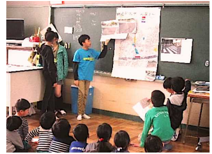
③交通安全リーダーと語る会