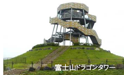
富士山ドラゴンタワー

「富士山ドラゴンタワー」から富士山～駿河湾の360度の美しいパノラマ景観をみよう 船型歴史学習施設「ディアナ号」もあるよ!