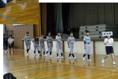
↑ <部活動壮行会・ 入場の一コマ>