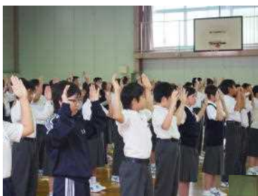
↑ <部活動壮行会・昼休み 1,2年生応援練習>