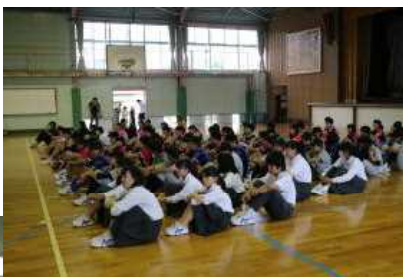
← <部活動壮行会・ ユニホーム姿の 3年生>