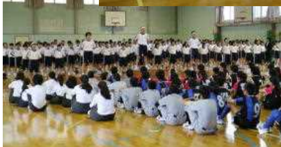
↑ <部活動壮行会・迫力ある応援>