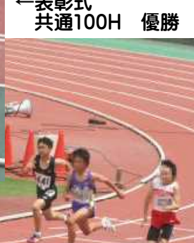
←表彰式 共通100H 優勝