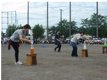
PTA種目 学級対抗水の祭典