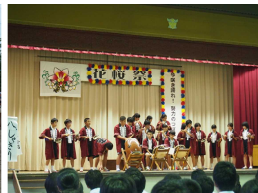
中郷中しゃぎりの会