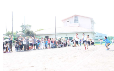
3年男子学級代表リレー