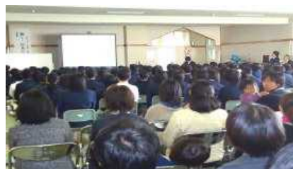
2年総合的な学習発表会

11月25日(日)に1日参観授業(オープンスクール)が行われました。多くの保護者の方にご来校いただき、ありがとうございました。普段のウィークデーに行われる参観日に参加できない保護者の方やお父様には、お子様の学校での様子をご覧になる良い機会になったのではないかと思います。当日は、お父様の姿が多かったように感じました。3年生は授業参観と進路説明会、学級懇談会、2年生は授業参観と総合(職業体験の発表会)、ハローワークの職員による職業講話、1年生は授業参観と道徳の授業、学年懇談会が行われました。また、昼休みにPTA学年部による「制服リサイクル」の販売が行われ、山田中に入学予定の小学生や保護者の方も来校され、サイズを合わせながら購入している姿が見られました。