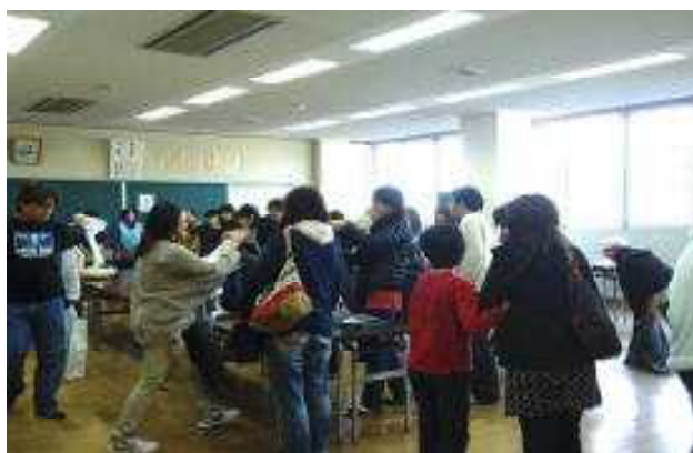
制服リサイクルの販売

11月25日(日)に1日参観授業(オープンスクール)が行われました。多くの保護者の方にご来校いただき、ありがとうございました。普段のウィークデーに行われる参観日に参加できない保護者の方やお父様には、お子様の学校での様子をご覧になる良い機会になったのではないかと思います。当日は、お父様の姿が多かったように感じました。3年生は授業参観と進路説明会、学級懇談会、2年生は授業参観と総合(職業体験の発表会)、ハローワークの職員による職業講話、1年生は授業参観と道徳の授業、学年懇談会が行われました。また、昼休みにPTA学年部による「制服リサイクル」の販売が行われ、山田中に入学予定の小学生や保護者の方も来校され、サイズを合わせながら購入している姿が見られました。